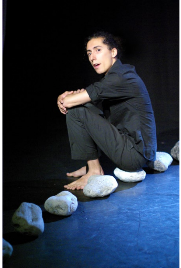
L'homme lors de la dernière scène avec la femme. (Séquence 5)