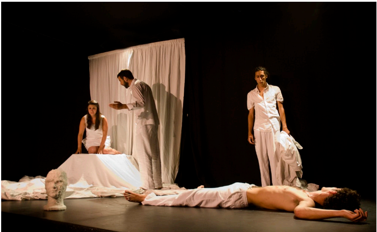
Le privilège des chemins au Festival d'Avignon off au Théâtre de l'Observance.

La Marseillaise – article de Myriam Stock