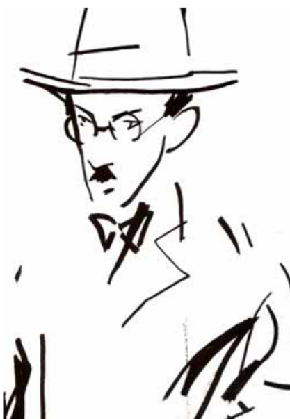
Fábio Godinho (L'Homme - metteur en scène)

La mise en scène est empreinte d'une poésie de la simplicité et les êtres qui la traversent arpentent des chemins faits de draps blancs dont les contours dessinent les frontières entre le rêve et la réalité.