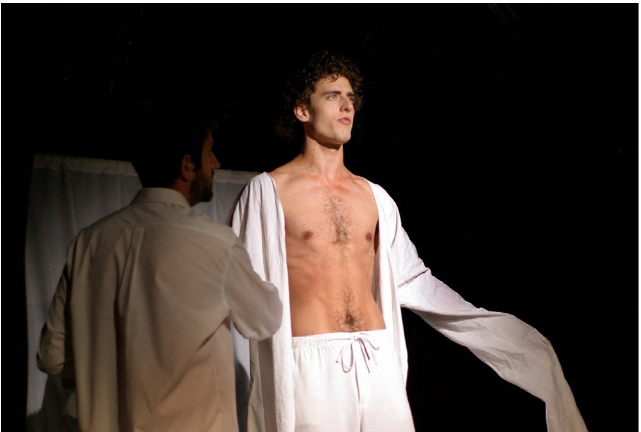
Le Prince et son serviteur. (Séquence 2)