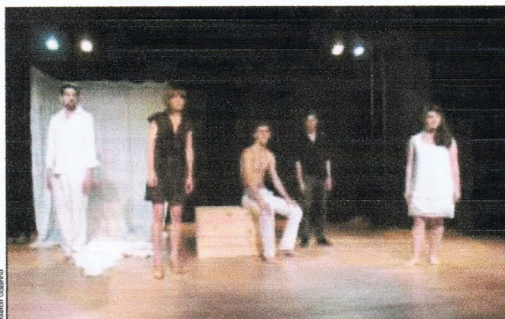
Peça de Fernando Pessoa au Festival Off d'Avignon

«Je suis intrigué par le Portugal, ce pays où Pessoa a vécu toute sa vie et pas moi. Il s'est créé des hétéronymes avec lesquels il a pu voyager. Le Portugal a nourri une partie incon-