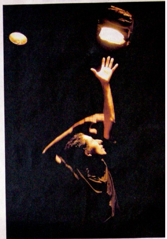
Le Privilège des chemins est de retour à Avignon après un premier passage remarqué en 2009.